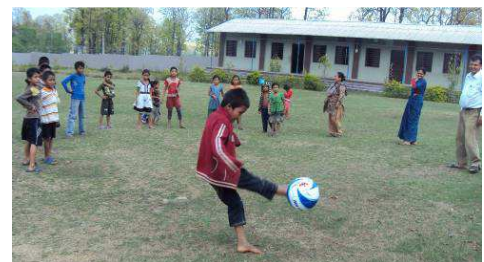
Schulkinder spielen Fußball

Gute Lernumgebung in Schulen: Die Kampagne „Lernen ohne Angst“ hat Kindern, Lehrkräften und anderen Erwachsenen bewusst gemacht, dass Schikane sowie verbale und körperliche Gewalt gegenüber Kindern beendet werden müssen. An über 210 Schulen haben Direktoren, Lehrkräfte, Gemeindeverwaltungen, Eltern und Schülerinnen und Schüler an entsprechenden Veranstaltungen teilgenommen. Zusammen mit Lehrpersonal, Schulkindern und Eltern wurden Verhaltensregeln aufgestellt, um jedwede Art von Gewalt an den Schulen und innerhalb der Familien zu vermeiden. Schulen wurden mit entsprechenden Spielen und Lehrmaterialien ausgestattet. Dies hat die Mädchen und Jungen ermutigt, ihre Ausbildung fortzusetzen.