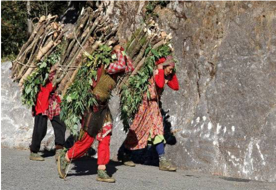
Frauen holen Feuerholz zum Kochen

Die meisten Familien betreiben Kleinst-Unternehmen mit dem Geld, das sie bei Frauen-Kooperativen leihen. Das Einkommen aus diesen kleinen Geschäften wird für die Ausbildung der Kinder und für die Grundbedürfnisse benötigt. Es gibt 594 reguläre Schulen. Die Mütter gehen beruhigt arbeiten, wenn ihre kleinen Kinder in die Vorschulen gehen.