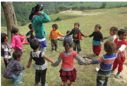
Kinder lernen im Kindergarten